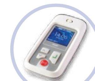
TREX Draagbare oproepontvanger