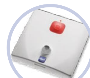
PUSH + PEAR