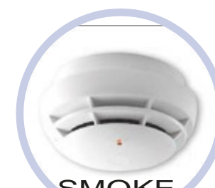
SMOKE Draadloze melder