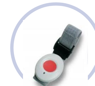
ATOM - zender